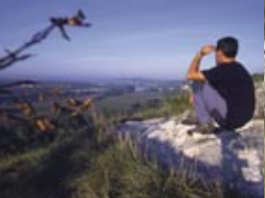
Coteaux de Seine