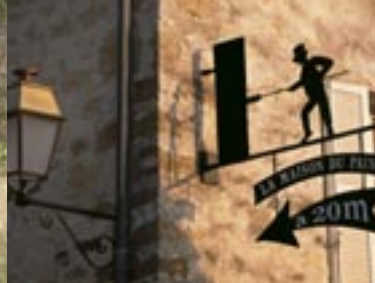
Maison du Pain