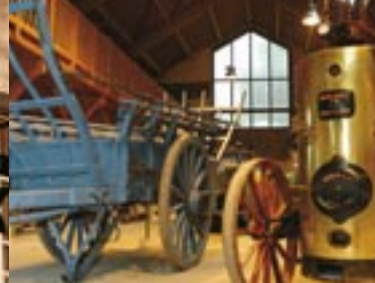
Musée de la Moisson