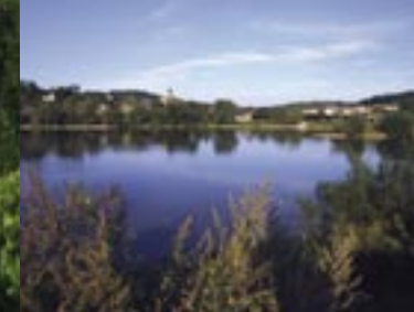
Bords de Seine