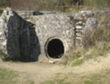
Allée couverte du Bois-Couturier