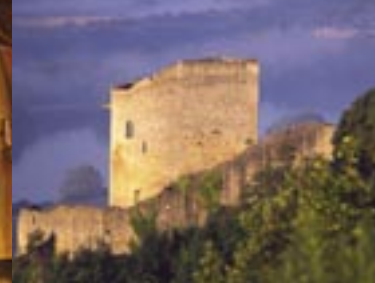
Donjon de La Roche-Guyon